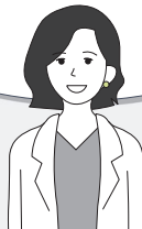
企業の総務担当者様

勤怠管理(ネットde就業)やWEB明細(ネットde明細)と連携して、 人件費や時間コストなどの削減 ができました。